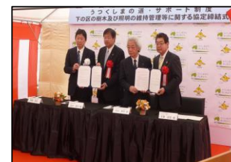
七日町通りまちなみ協議会 (会津若松市) 平成30年4月27日