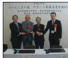
郡山市湖南町中野区 (郡山市) 平成31年1月23日