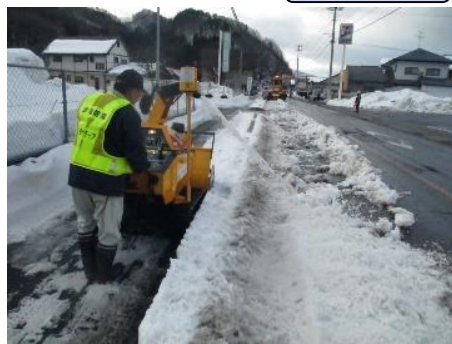
国道121号 新町行政区（南会津町）