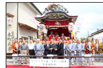
白河市本町自治会 (白河市) 平成30年9月16日