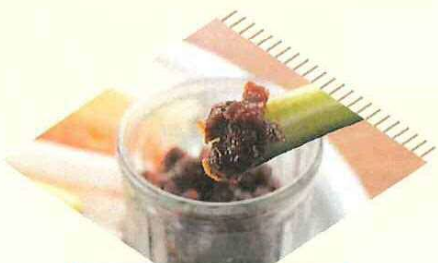
青唐みそ こんにゃく