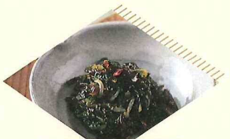
下郷高菜と きくらげのしぐれ