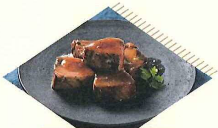
かつお浅炊き おろし煮