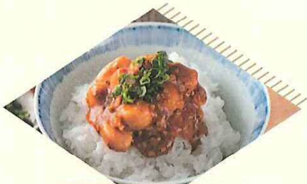
伊達鶏 にんにく味噌