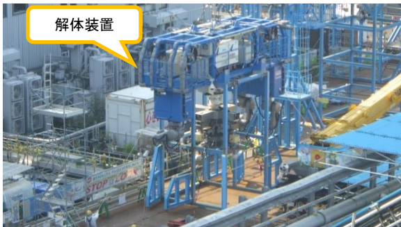
(写真2-1) 吊り上げ時の状況