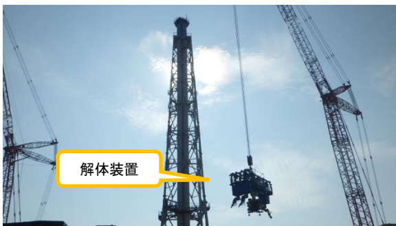
(写真2-2) 吊り上げ後の状況