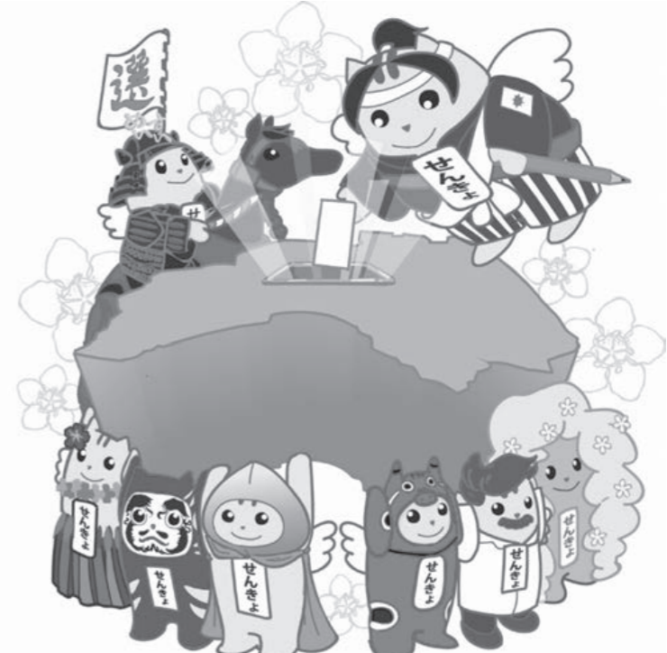
啓発イメージキャラクター ご当地めいすいくん