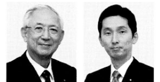
前衆議院議員 公明党幹事長 井上 義久 いのうえ よしひさ 前衆議院議員 真山 祐一 まやま ゆういち