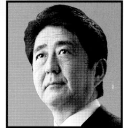
自由民主党総裁 安倍晋三