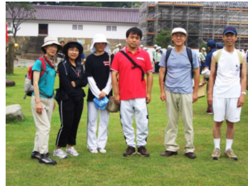
↑建設事務所の参加メンバー。 ゴール間近で足下がおぼつかない人も↑