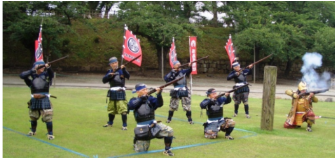
←会津鉄砲隊の号砲