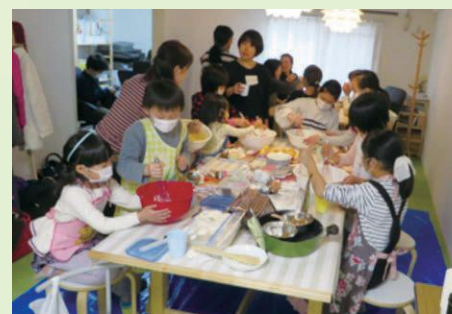
「こころん」でチョコレートづくり交流会

私たちは広いエリアを担当していますが、お受けした相談はそれぞれの避難者に寄り添って解決まで対応します。避難者の方が相談しやすいように、来所と電話、メールによる相談を毎週月、水、金曜日の午前9時30分から午後4時30分まで受け付けています。