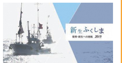
<最新動画> 新生ふくしま 復興・創生への挑戦2019