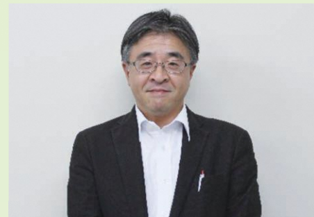
皆様のお声を聞かせください

宮城県へ県外避難されている皆様を対象とした相談室です。毎週火、水、金曜日の午前11時から午後6時まで専用電話（080-9259-7049）にて受け付けしております。対面での相談もちろんOKです。専門機関とも連携しており、個別相談会&交流会（年1回予定）も行っています。県内にあるサロンや県内外の支援団体、専門機関等の紹介冊子も発行しています。定住や帰還に関わらず住居や就労、就学…etc.分からないこと、相談等がありましたらお気軽にお問い合わせください。