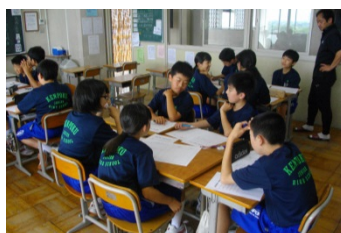
解決に向けた話し合い②