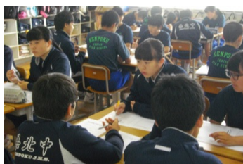
解決に向けた話し合い①