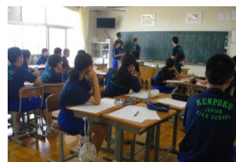
学級としての解決策提案