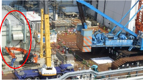
(写真2-1) 6月6日撮影 丸印部分にいくつかの工作物がある