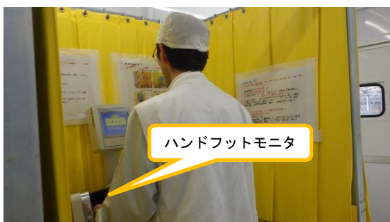
(写真 2 - 1) ハンドフットモニタ