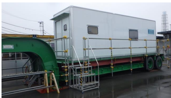
(写真 1 - 1) 常設給水所の外観