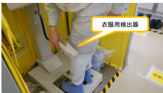
(写真 2 - 2) 衣服用検出器