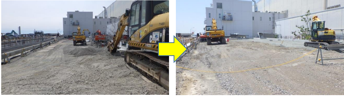
(写真1) 逆洗弁ピット覆工の状況(北側から撮影)(左側：前回、右側：今回)