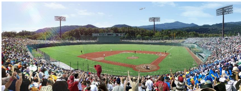
あづま球場人工芝化のイメージ