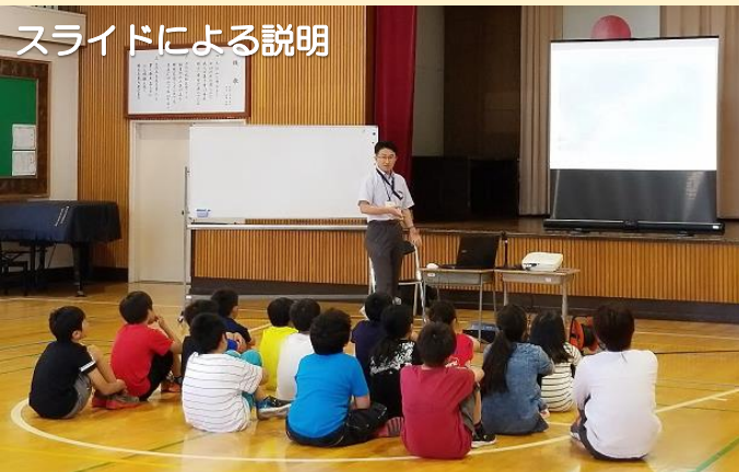
スライドによる説明

防災とは何か、大雨が降るとどのような危険があるのか、自分たちに出来ることは何か(普段の心構えと備え)等について学習しました。