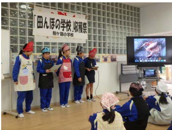
「田んぼの学校活動報告（収穫祭）」