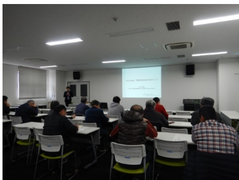
「農業経営講座の様子」