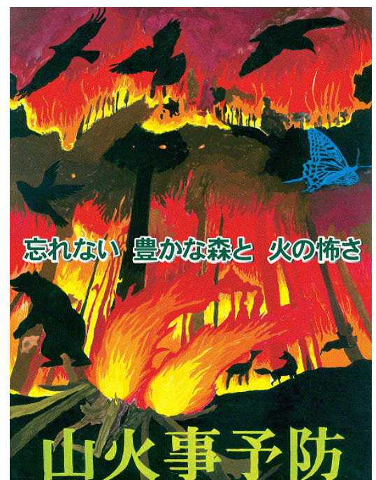
「山火事予防ポスター」