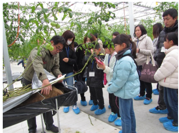
「ひばり菜園見学の様子」