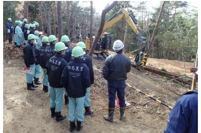
「ハーベスタによる枝払いの実演」