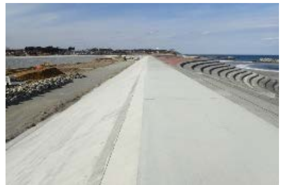
「復旧が進む村上地区海岸」