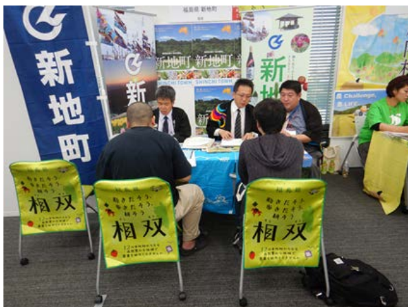
「就農フェア出展の様子」