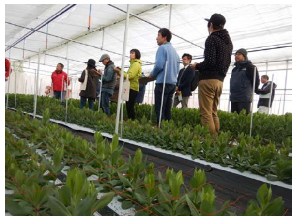
「バスツアーでの農業現場視察」