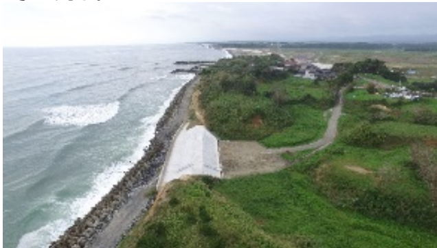
「復旧が完了した小浜雫地区海岸」

今年度は平成30年8月までに、小浜雫地区海岸（南相馬市原町区）と井田川地区海岸（小高区）の復旧工事が完了。