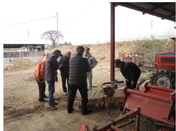
「石澤農園での視察研修の様子」