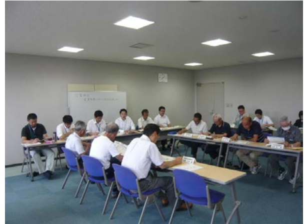
「営農再開ビジョン策定のための意見交換会の様子」