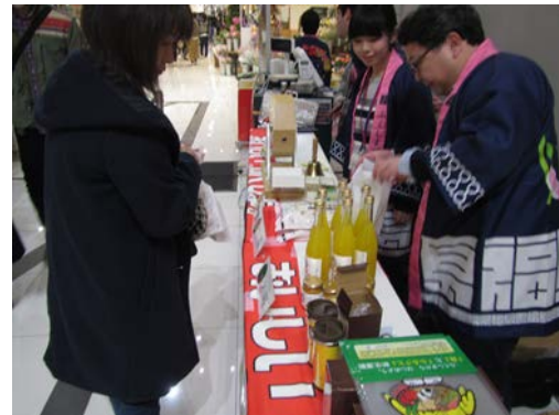
「浜通りの特産品などが当たる抽選会」