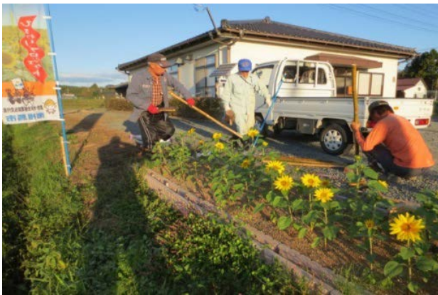
「ひまわりの植栽活動」

他市町村に避難した若者世代が再び戻ってくる事を信じて、これからも活発な活動を通して地域住民の結束力を強め、震災前のような活気を取り戻していく事を期待しています。 (農村整備部)