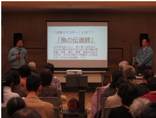
「相馬魚類株式会社の講話の様子」