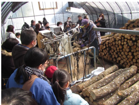
「原木シイタケの植菌作業」