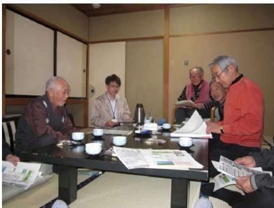
「実証ほに関する意見交換」