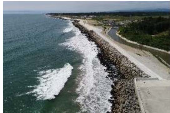
「復旧が完了した井田川地区海岸」

また、平成31年3月末までに村上地区海岸（小高区）、中浜地区海岸（浪江町）、繁岡地区海岸（楢葉町）の3地区海岸も完了する見通しであり、これにより相双管内で災害査定を実施した16農地海岸のうち、15海岸の復旧工事が完了となる予定です。