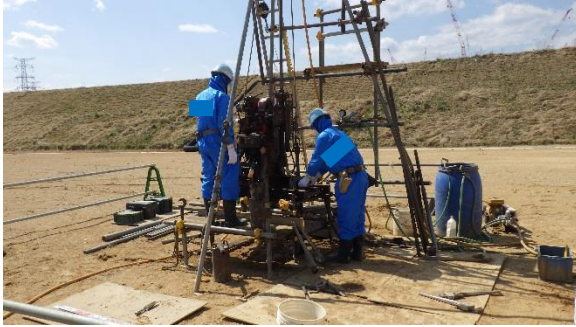
(写真2) 追加ボーリング地点の作業状況