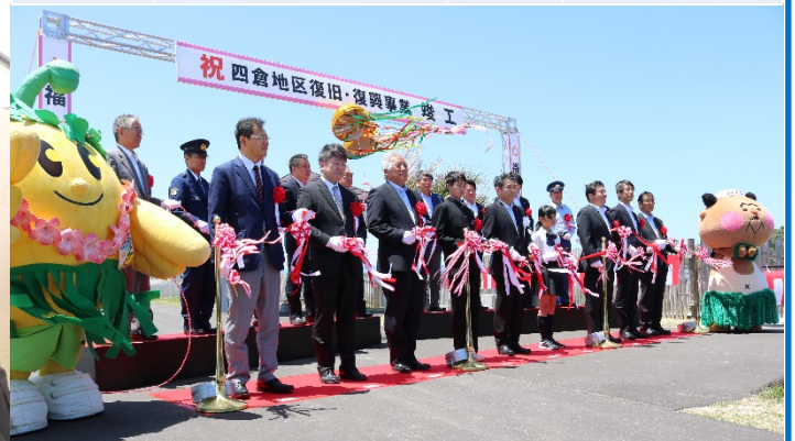
テープカット・くす玉開披