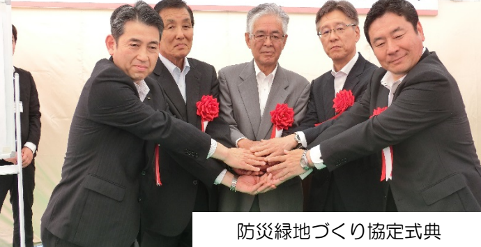
防災緑地づくり協定式典