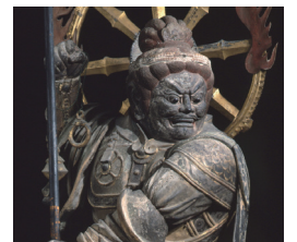
国宝「四天王像 広目天」(部分) 興福寺(東金堂所在)

平安時代初期に奈良の興福寺より会津を訪れ、仏教文化を根付かせた僧・徳一。徳一がつなひだ縁をもとに、興福寺の寺宝の数々と会津の仏教美術を紹介します。