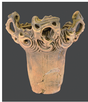
天栄村桑名邸遺跡出土縄文土器

過去5カ年にわたって進めてきた縄文・弥生土器の年代測定の結果を、対象試料160点とともに公開します。