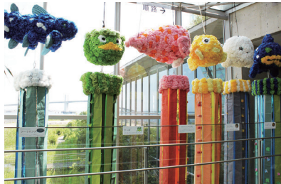
七夕飾り(過去開催の様子)

館内の生き物たちをモチーフにした七夕飾りを展示します。スタッフ手作りのユニークな飾りをぜひご覧ください。