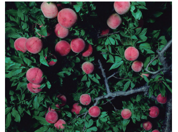
「女神と男神が桃の木の下で別れる」川中島(部分) 2016年 作家蔵

初公開となる新作を中心に、日本神話を題材に福島の桃を撮影したシリーズをはじめ、美術家やなぎみわ(1967-)のくみ尽くせめ創造の泉に迫ります。