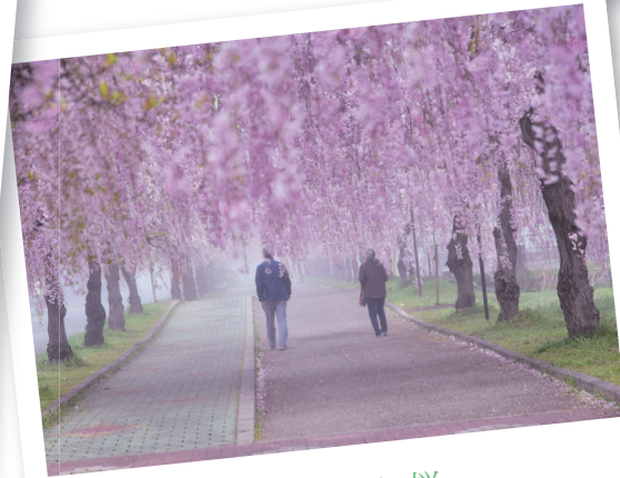
喜多方市 日中線のしだれ桜