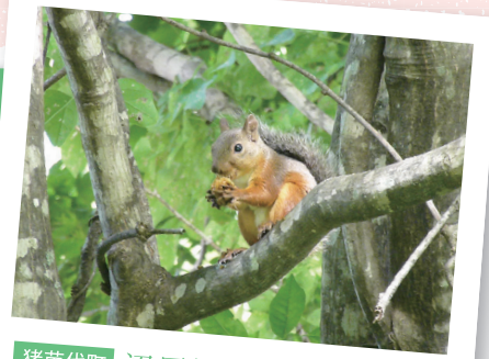
猪苗代町 沼尻温泉 ニホンリス