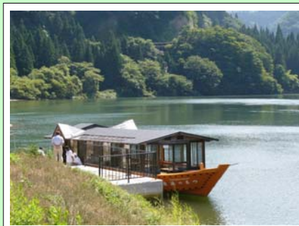
早戸駅 の つるの湯