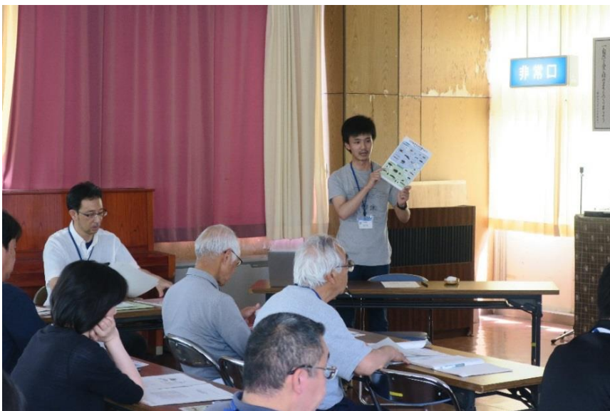
講義「指標生物の説明」(大平特任助教)