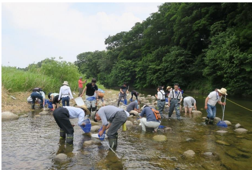
水生生物採集の様子