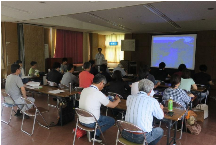
講義「水生生物調査の方法」(塘教授)