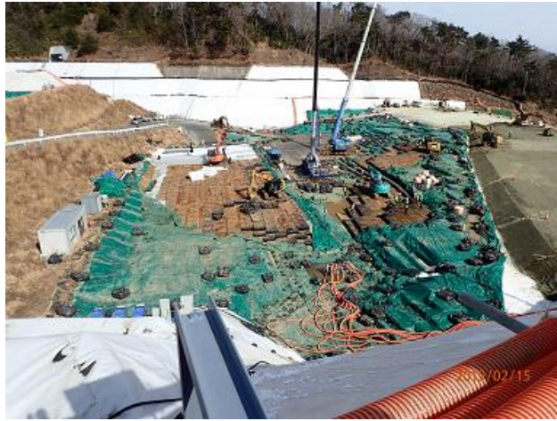
下流側埋立地の埋立状況の確認