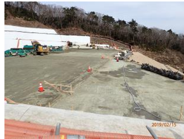
土堰堤の築堤状況の確認