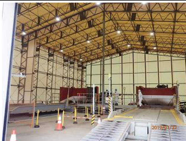
土壌貯蔵施設の稼働状況の確認