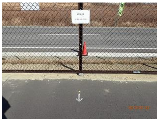
モニタリング地点の表示の確認