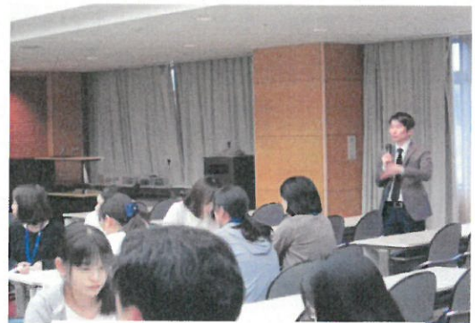
災害時のメンタルヘルスケア研修