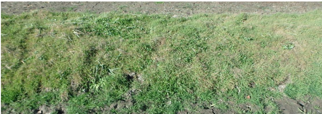
図2 クリーピングベントグラスの被覆状況 (手除草区、2018/12/13)