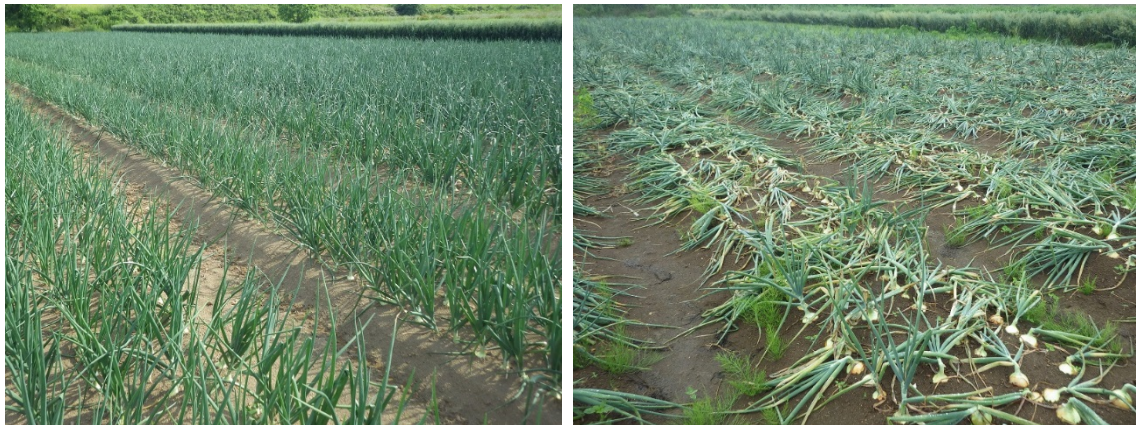
図1 秋まきタマネギの様子(左: 茎葉肥大期5月下旬、右: 倒伏期6月中旬)