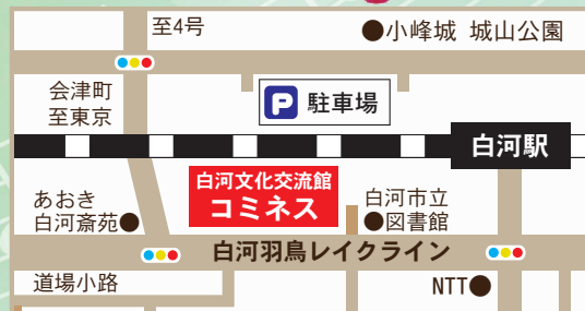
※駐車場は、JR東北本線北側のコミネス駐車場をご利用ください。