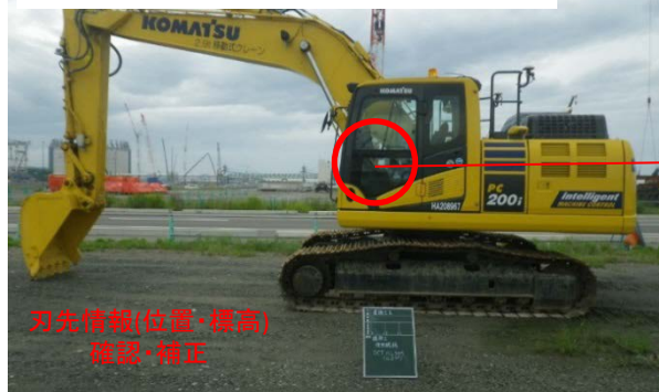
3次元マシンコントロール付バックホウ