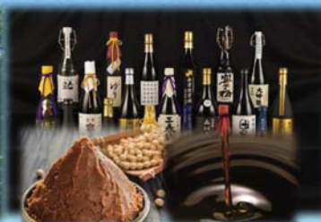
農林水産物や日本酒の販路拡大 味噌・醤油の魅力向上