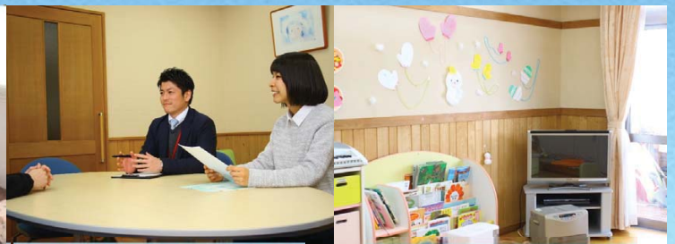
支援を必要とする子どもに 対する身近な相談体制の充実