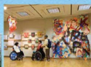
芸術文化活動等を通じた 障がい者の社会参加促進