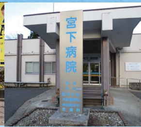
宮下病院の機能強化に向けた検討