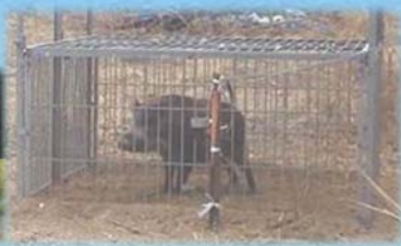
イノシシ被害対策を効果的に実施