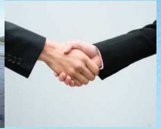
被災市町村への支援