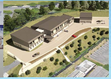
水産海洋研究センター 新庁舎の供用開始