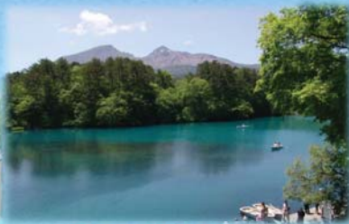
自然公園の魅力向上