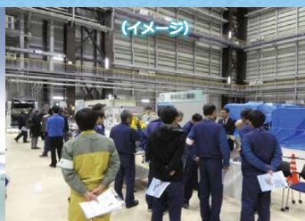
地元企業の廃炉関連産業 への参入を促進