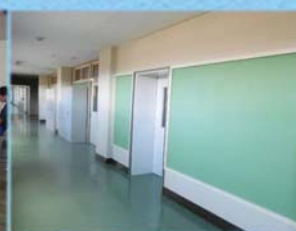
高校や特別支援学校の 大規模改修を推進