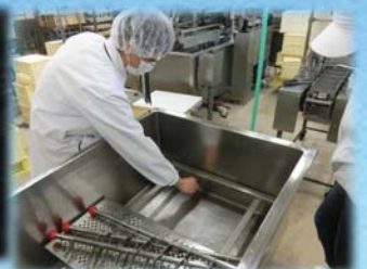
加工食品の信頼性を確保