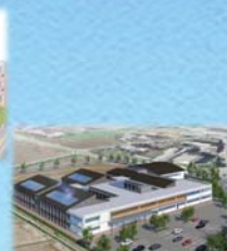
相馬支援学校の整備