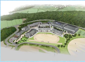
ふたば未来学園中学校の開校 中高一貫の新校舎完成