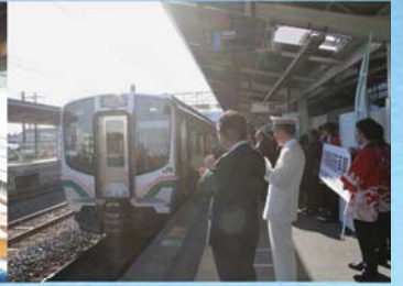
J R常磐線の全線開通を 契機とした観光誘客