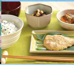
バランスの良い食事や減塩に関するキャンペーン