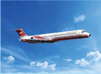
台湾との定期チャーター便を 通年運航