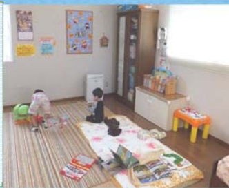
病児保育の広域的な受け入れ、 キッズスペース設置への支援