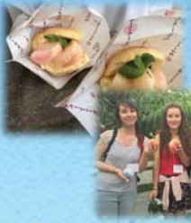
食の魅力とインバウンド対策を 融合した新たな観光誘客