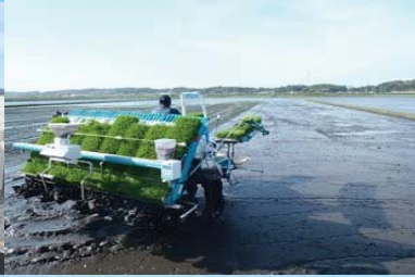
営農再開等への支援