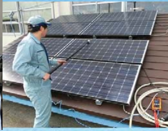
県内企業の再エネ関連 メンテナンス産業への参入促進