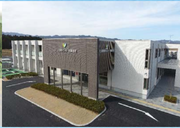
ふたば医療センターによる 医療提供体制の確保