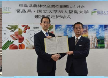
福島大学食農学類との連携 による産地競争力の強化