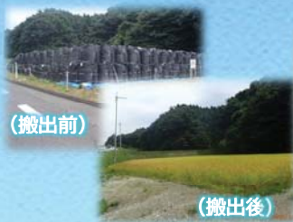
除染土壌を着実に搬出