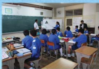
教員の指導力向上 英語教育の充実