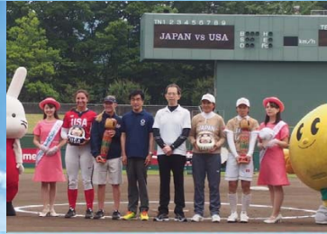
オリンピックに向けた機運醸成や 会場準備等を加速