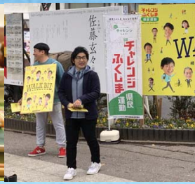
健民プロジェクト大使等との共働によるウォークビズの拡大