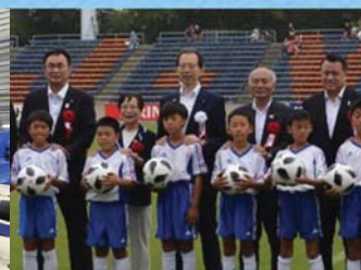
Jヴィレッジの全面再開 魅力を広く発信