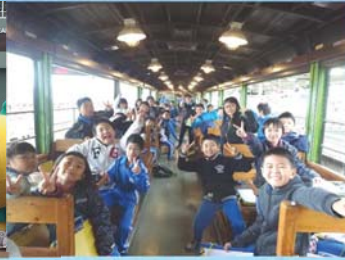
J R只見線の復旧や 利活用を一層促進