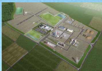
ロボットテストフィールドの整備