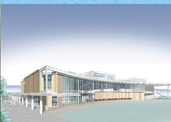
アーカイブ拠点施設の整備