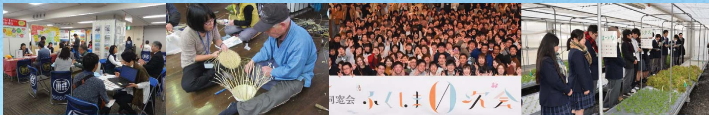
移住される方々への支援を一層充実