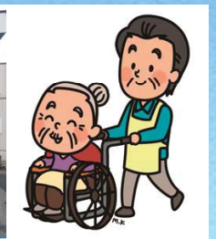
医療・福祉・介護人材の確保