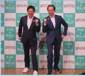
知事をトップとした新たな推進組織による健康づくり