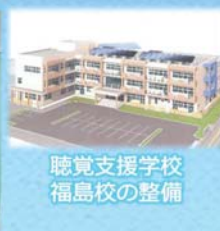
聴覚支援学校 福島校の整備