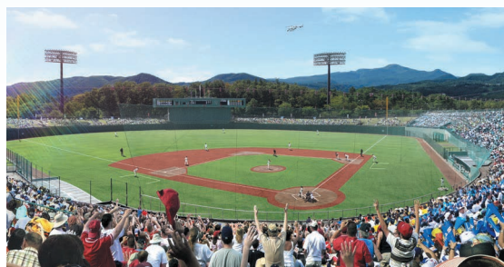
完成予想イメージ

「復興オリンピック」に ふさわしく、開会式に先 駆けて2020年7月22 日にソフトボール競技が 開催され、野球は7月29日 開催予定です。 現在、福島あづま球場 の改修工事を進めてお り、今年の9月に内外野 とも人工芝のグラウンド に生まれ変わります。