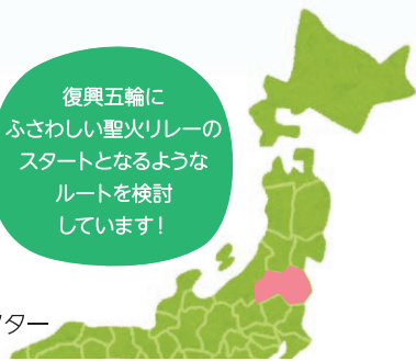
福島県復興シンボルキャラクター キプタン

復興五輪に ふさわしい聖火リレーの スタートとなるような ルートを検討 しています！