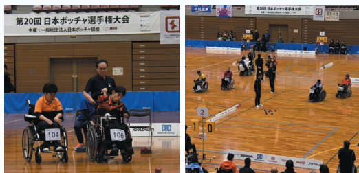
福島市国体記念体育館でのボッチャ日本選手権BC1クラスの3位決定戦は県勢同士の戦いとなりました

県では、選手権大会レベルのスポーツ競技大会などの県内開催を誘致しています。 オリンピック・パラリンピック出場選手など世界レベルで戦う選手たちを皆さんに直接見て感じていただく機会を増やし、東京2020大会を盛り上げていきます。