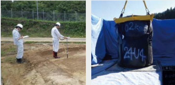
現地調査や試験の様子

除染により発生した除去土壌等は、除染を実施した現場や仮置場で一時保管された後、中間貯蔵施設へ輸送・保管し、福島県外で最終処分することとされています。除去土壌等の一時保管が継続されている仮置場がある一方、中間貯蔵施設への輸送量は年々増加しており、保管する全ての除去土壌等の輸送が終了した仮置場も出てきています。