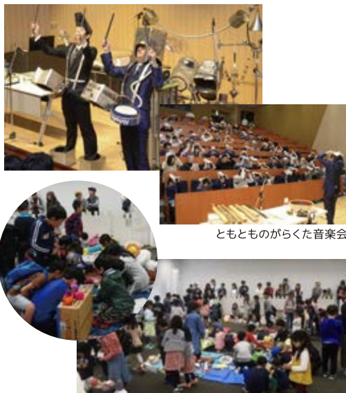
ともものらくた音楽会

また、駐車場では、MOTTAINAIフリーマーケット、会議室では、売るのも買うのも子どもだけのMOTTAINAIキッズフリーマーケットを開催しました。キッズフリーマーケットでは、ほぼ全員が初出店で、最初は恥ずかしがってなかなか声がかけられないお子さんもありましたが、最後にはスタッフや他のお子さんの声に触発されて盛んに声を出し、賑やかな開催となりました。