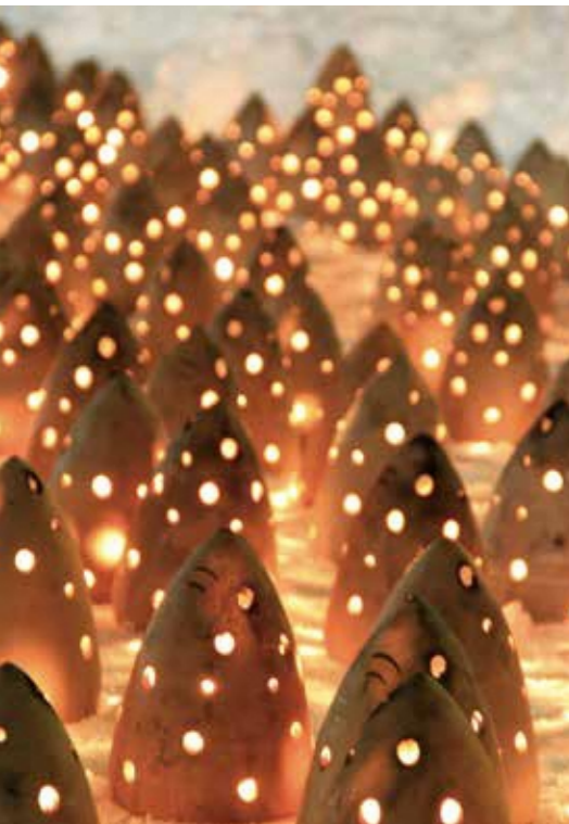
会津絵ろうそく祭り

尾瀬は、福島、栃木、群馬、新潟の4県にまたがる国立公園です。メインルートが群馬県側にありますが、尾瀬といえど群馬県をイメージする人が多いと思いますが、面積範囲がもっとも広いのは福島県側です。宿泊できる山小屋も福島県にあります。 また、映画「フラガール」の舞台となったいわき市には、「スパリゾートハワイアンズ」や「アクアマリンふくしま」など、大型観光施設が点在します。 福島県のご当地グルメの筆頭である喜多方ラーメンは、札幌ラー