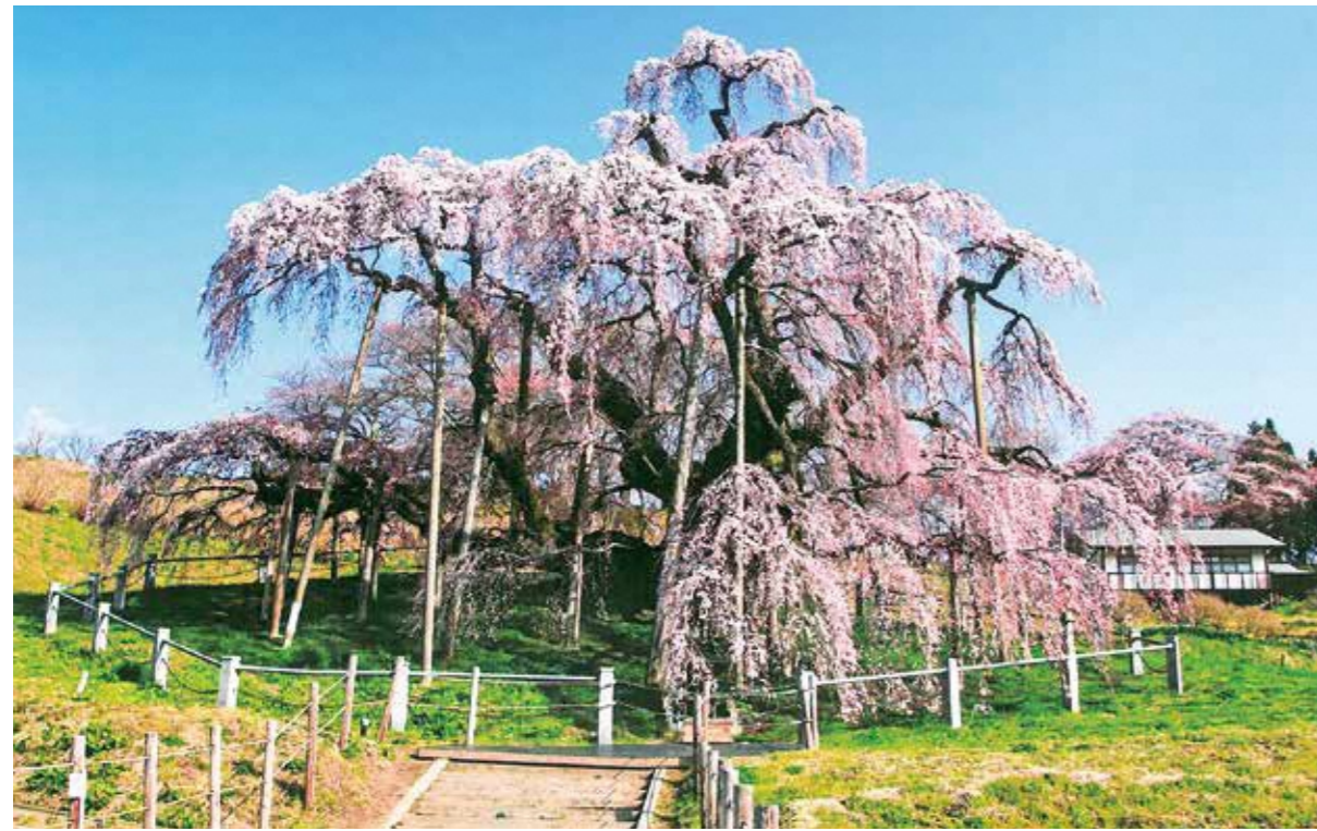
三春滝桜:日本三大桜のひとつに数えられる桜。国の天然記念物に指定。樹齢1000年以上といわれ、滝が流れ落ちるように見えることから、滝桜と呼ばれるようになった。