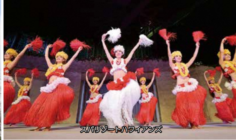
スパリゾートハワイアンズ