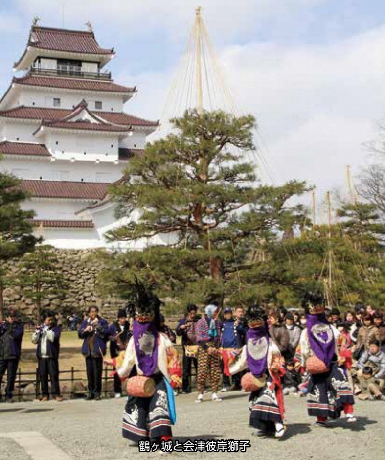
鶴ヶ城と会津彼岸獅子