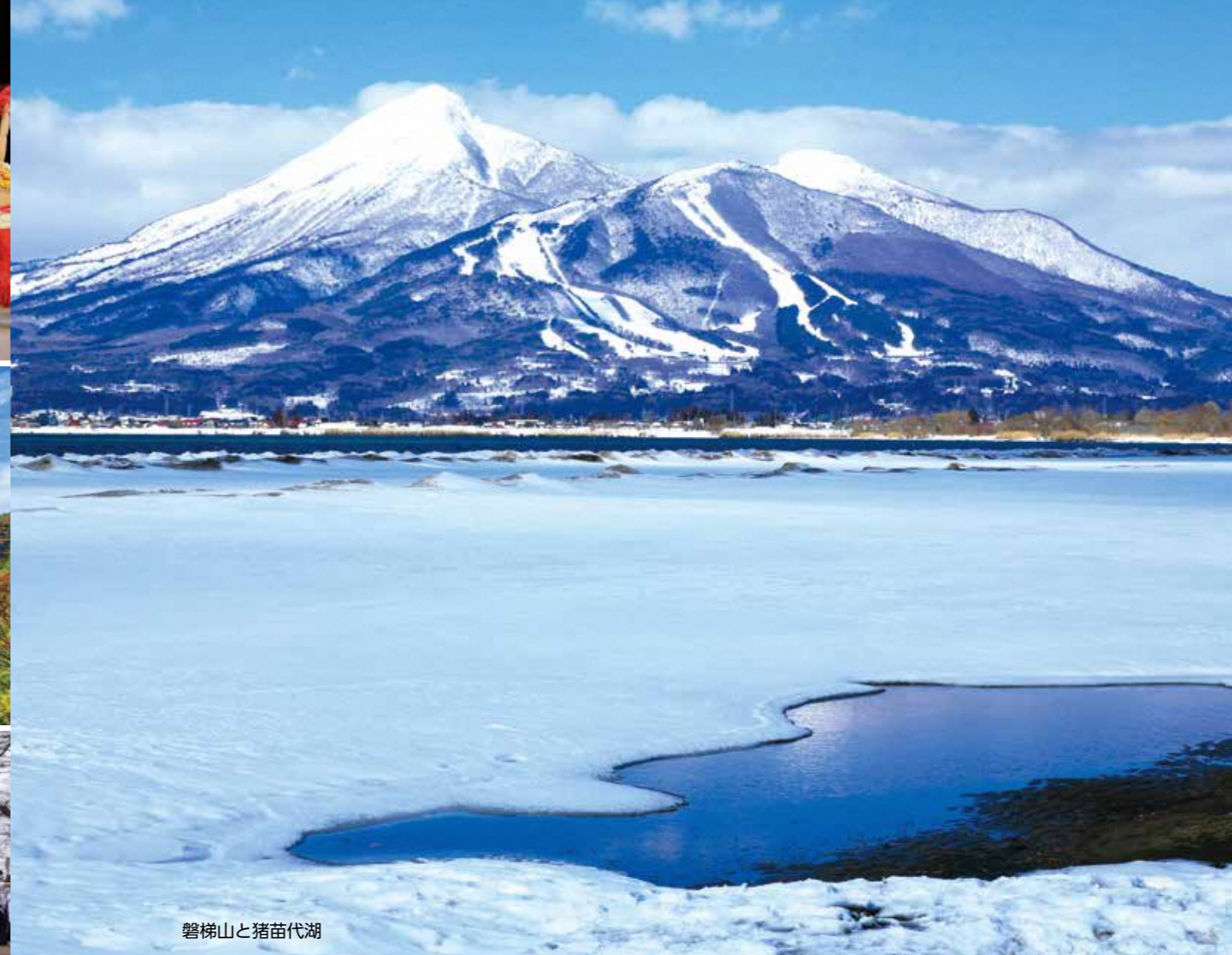
磐梯山と猪苗代湖