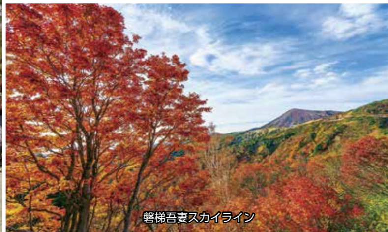
磐梯吾妻スカイライン