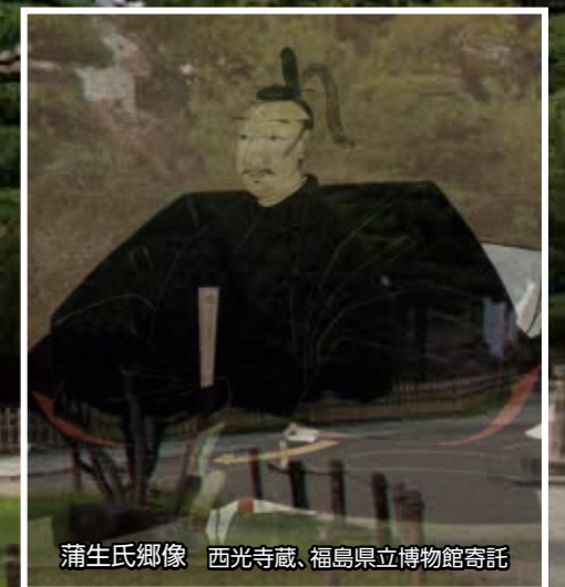
蒲生氏郷像 西光寺蔵、福島県立博物館寄託

至徳元年(1384年)、葦名直盛によって東黒川館として築かれたのがはじまり。天正18年(1590年)に会津移封となった蒲生氏郷が本格的な天守閣を備えた城へと改築。名称を「鶴ヶ城」と改めた。難攻不落の名城と謳われた鶴ヶ城。戊辰戦争で新政府軍が1ヵ月猛攻しても落ちなかった。石垣だけを残して取り壊されたのは明治7年。現在の天守閣は昭和40年9月に再建された。平成23年の春、赤瓦への全面葺き替えが行われ、幕末当時の姿に生まれ変わった。城址公園のほとんどが国指定史跡となっており、春は桜が美しい。平成27年4月、天守閣再建50周年を記念して、展示室が全面リニューアルされた。