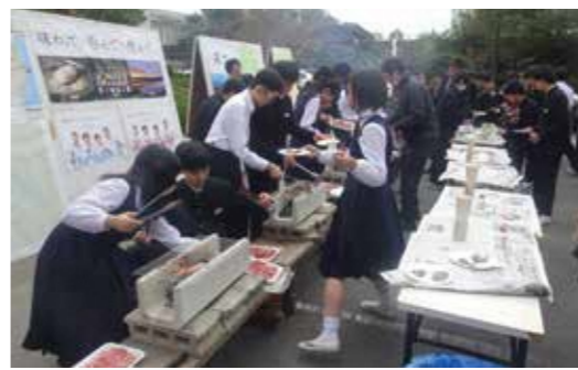
愛教大附属岡崎中学校 文化祭

畜産農家の人や村の中学生などいろいろな方から話を聞いたそうです。それが牛肉を食べるイベントにつながったのですが、じつはその生徒さんたちは名古屋事務所にもいらっしやいました。そのとき、食の安全性や農産物のブランド化についての質問をされたのですが、大変に優秀な生徒さんたちでしたから、鋭い質問にこちらがタジタジとなってしまいました。 福島県は魅力のある観光地も少ないようです。 関本 鶴ヶ城、猪苗代湖、尾瀬。