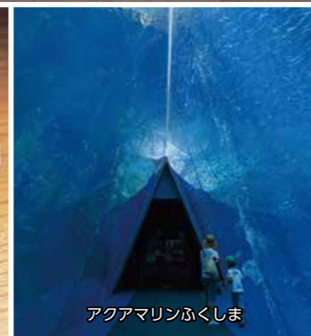
アクアマリンふくしま