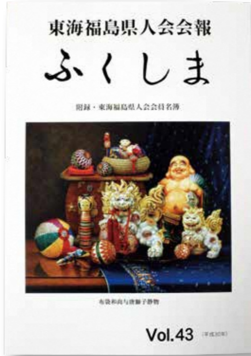
表紙は大竹幸一画伯の絵画。写真に見えるが、非常に細密に描かれた油彩画。