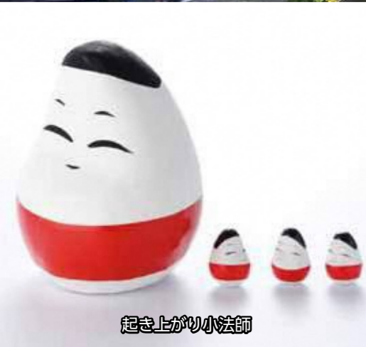
起き上がり小法師