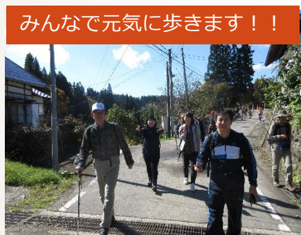
みんなで元気に歩きます！！