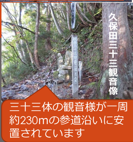
久保田三十三観音像