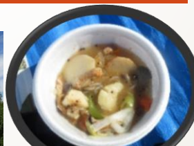
きのご汁のサービス