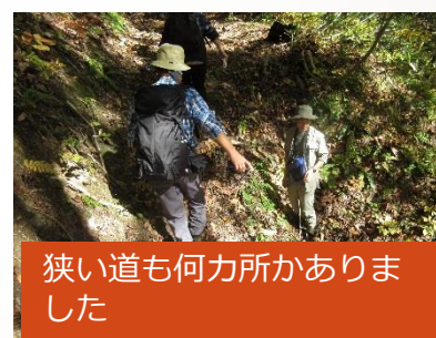
狭い道も何力所がありました