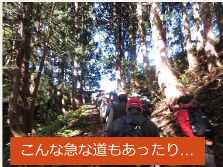
こんな急な道もあったり...