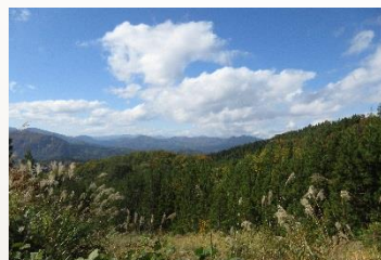
壮大な景色です。癒やされます★