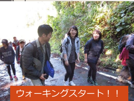
ウォーキングスタート！！