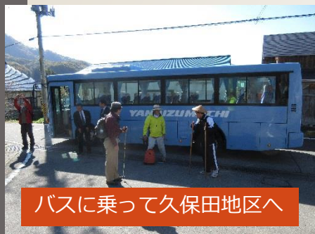
バスに乗って久保田地区へ