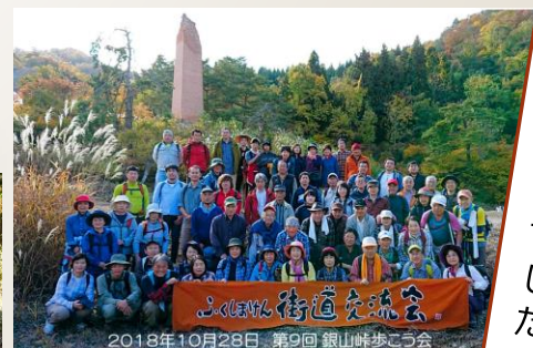
2018年10月28日 第9回 銀山峠歩こう会