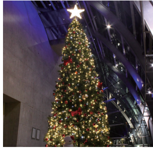
高さ5.5メートルのアクアマリンツリー

高さ5.5メートルのアクアマリンツリーを展示するほか、クリスマスにちなんだ楽しいイベントを開催します。12月23日(日・祝)・24日(月・休)は、開館時間を午後7時まで延長します。