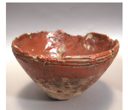
漆塗り土器 鉢 (三島町 荒屋敷遺跡) 縄文時代晩期

縄文時代から人々の暮らしの中に息づいてきた漆。国の重要文化財への指定が今年3月に答申された三島町荒屋敷遺跡出土品(縄文晩期)をはじめ、美しく輝く漆工芸品を紹介いたします。