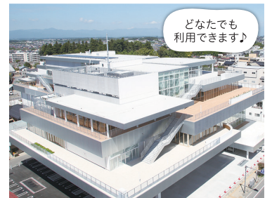
どなたでも利用できます♪

図書館、生涯学習、子育て支援などの機能を持つ複合施設です。特に「円谷英二ミュージアム」(入館無料)は、特撮映画撮影スタジオを再現した体験コーナーなどがあり、必見です。