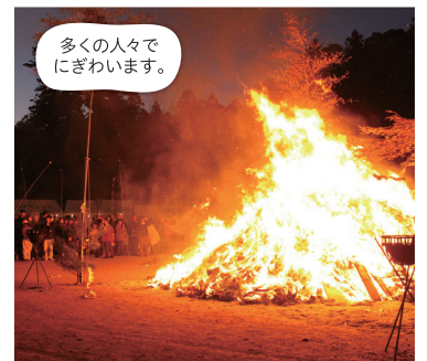
多くの人々にぎわいます。