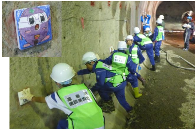
ロックボルトのキャップの装着

橋梁工事の現場では、スコップでの人力掘削を体験してもらうことで、建設機械による掘削が「いかに速く効率よく作業できるか」を身をもって感じてもらいました。また、トンネル工事の現場では、建設重機への搭乗体験や、事前に好きな言葉やイラストを描いたロックボルトのキャップを装着してもらいました。