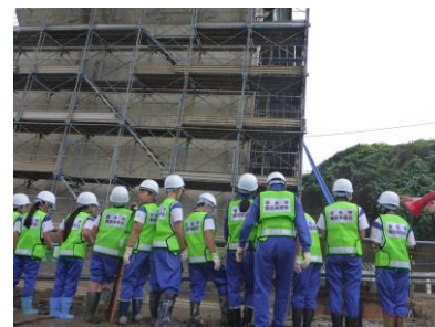
工事現場を間近で見学