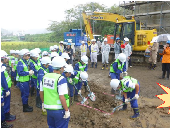
スコップでの人力掘削