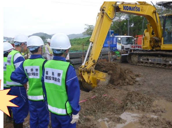
バックホウの機械掘削