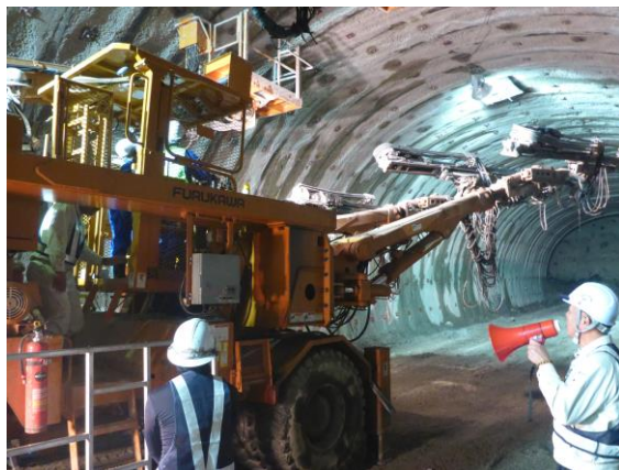
建設重機への搭乗体験