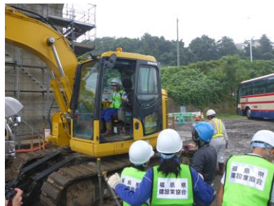
バックホウへの搭乗体験