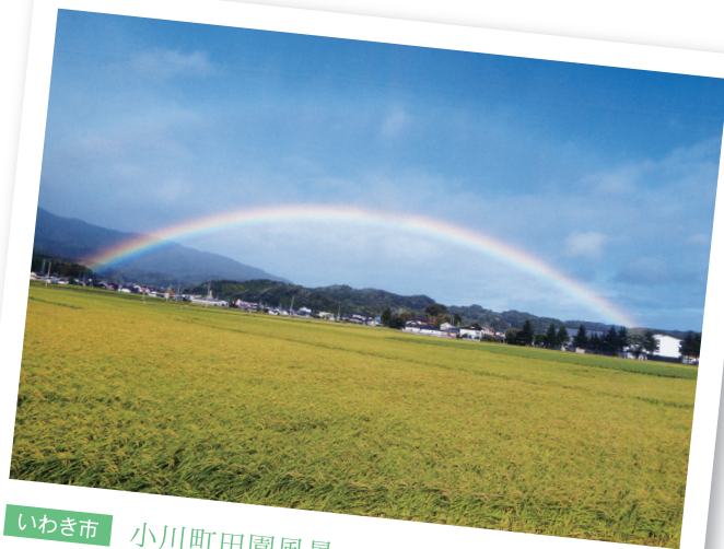
いわき市 小川町田園風景