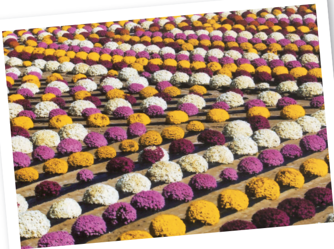
田村市 菊の里ときわ

※応募はデータでも写 真でもOKです。撮影 場所を記入してくださ い。画像や写真は返却 いたしません。