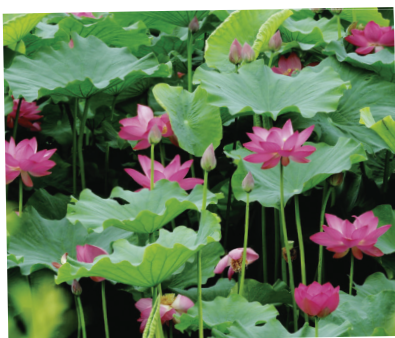
会津若松市 会津総合運動公園 白虎池