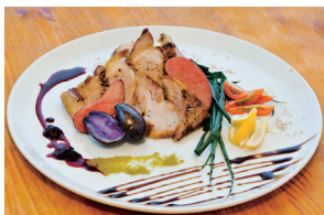
「エゴマ豚のロースト」は自家製のエゴマ塩やフルーツソースで。

オープン6年目を迎える「月海-Ruu-」は、現役ラグーマンのオーナーシェフが腕をふるう植田駅徒歩10分の隠れ家風ダイニング。料理に使われる食材は、そのほとんどが地元・いわき市産。生産者を1軒ずつ訪ね、信頼関係を築いた上で仕入れをすることを徹底し、旬の味覚をそれに合った調理法で提供しています。人気は福島牛やエゴマ豚、伊達鶏など県産肉のメニュー。カラフルな野菜が華を添えるボリュームーなひと皿は、仲間同士でシェアするのにぴったり。「いわき市は食材の宝庫。旬のおいしさを大切に、“一期一会”の料理で豊かな食文化を伝えていけたらと思っています」