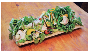
15種類もの新鮮な野菜を豪快に盛り付けた「自然派サラダ」。