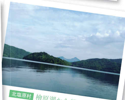
北塩原村 檜原湖から望む磐梯山