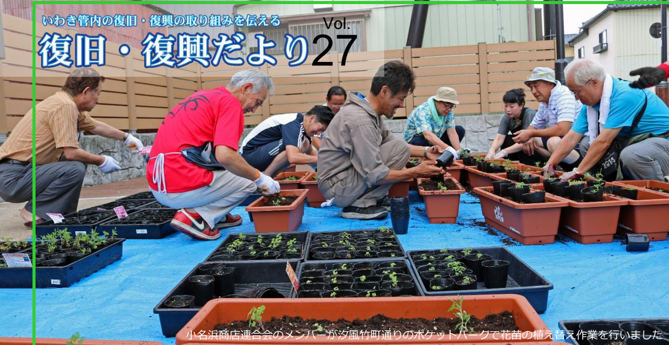
小名浜商店連合会のメンバーが汐風竹町通りのポケットパークで花苗の植え替え作業を行いました

「道で咲かせよう東北の花プロジェクト」の活動 活動の場となった汐風竹町通りのポケットパーク — ポケットパークが賑わうと街も明るくなる — —