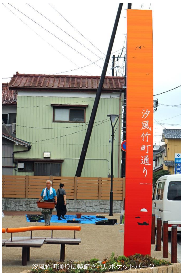
汐風竹町通りに整備されたポケットパーク