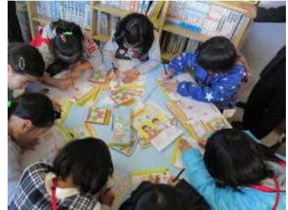
【一生懸命に書いてます】

下郷町では、子ども教室が毎日行われています。登録している人数も非常に多く、大変な部分やご苦労も非常に多いかと思えます。しかしながら、指導員の方々は、それぞれの持ち場で子どもたちを見守り、協力し合いながら、生き生きと活動されている様子が見られました。また、要所要所に指導員の方々の子どもたちに対する愛情が詰まっていました。