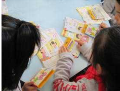
【クレヨンをいただきました】