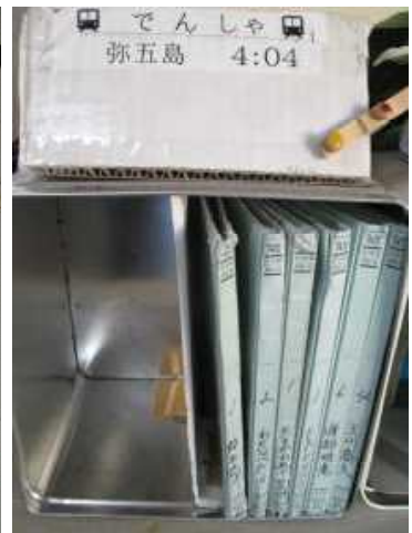
【帰る手段に合わせたBOX】