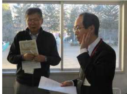
【局長さんからのお話】