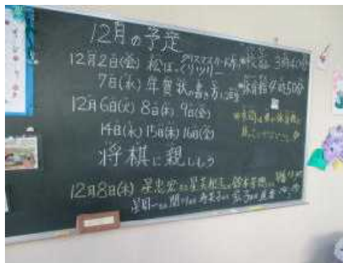
【月の予定が書かれた黒板】