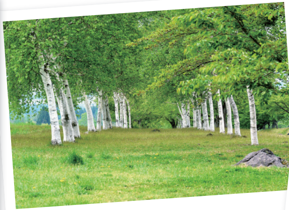
猪苗代町 町宮磐梯山牧場