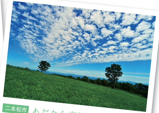
二本松市 あだたら高原