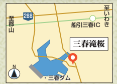
所在 / 三春町滝