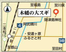
所在 / 二本松市木幡

享保20年(1735年)、この大スギの所有をめぐる、神・仏奉持者間に争いが生じ、大岡越前守の裁きで隠津島神社有と定められた、と伝えられる。