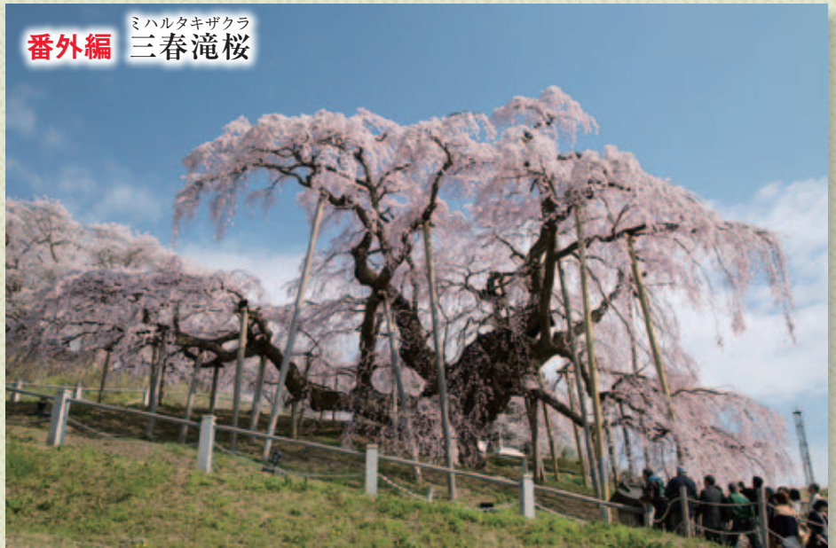
ミハルタキザクラ 番外編 三春滝桜