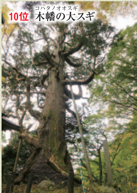
コハタノオオスギ 10位 木幡の大スギ

享保20年(1735年)、この大スギの所有をめぐる、神・仏奉持者間に争いが生じ、大岡越前守の裁きで隠津島神社有と定められた、と伝えられる。