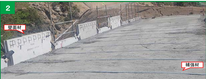
補強材の設置状況

※「補強土壁」とは、鋼製の補強材とコンクリート製の壁面材とを連結して組み立てた土留め壁です。