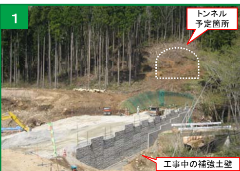
いわき市側の工事状況

※「補強土壁」とは、鋼製の補強材とコンクリート製の壁面材とを連結して組み立てた土留め壁です。