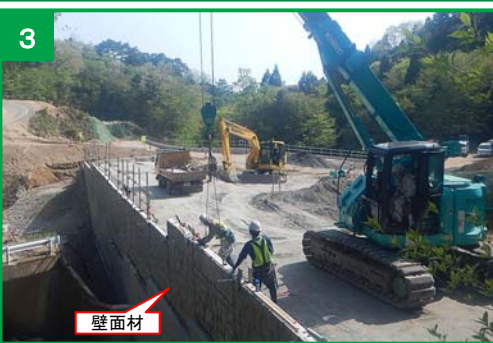
壁面材の設置状況

※盛土は20cm程度ごとに敷均し・締固めを行い、十分に締固めた後に鋼製の補強材(長さ5.0～6.5m)を設置します。