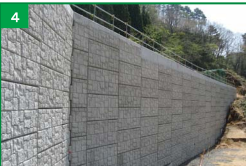
補強土壁の完成状況

※クレーンにて、コンクリート製の大型壁面材(高さ約1.2m、幅約2.7m)を設置しています。