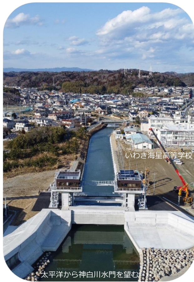
いわき海星高等学校

平成29年12月に本校に隣接する神白川に県内2番目となる水門が完成しました。神白川の下流部には住宅地が密集しているため、東日本大震災の際にも津波による大きな被害があった場所です。私は今回完成した水門の見学会にクラスで参加し、実際に水門のゲートが開閉する様子など間近で見ることができました。災害は決して起きて欲しくはありませんが、水門の大きさと頑丈さは万が一の際に私たちを守ってくれる心強い施設であると実感しています。