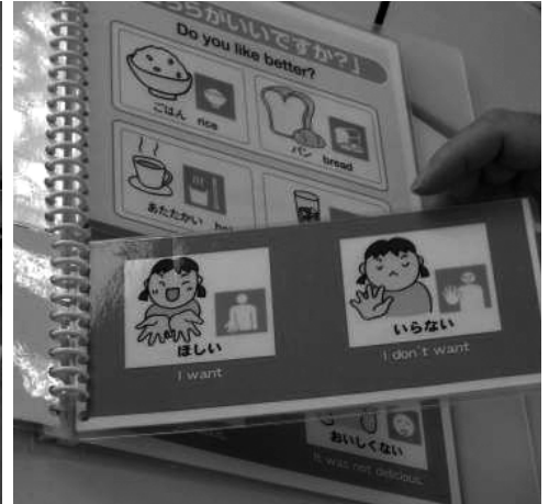
写真左) 第1回養成講座で行われたワークショップの様、 右) ワークショップのテーマ『コミュニケーションボード』