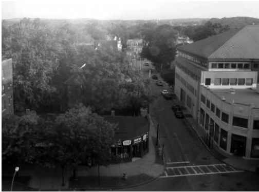
写真)ボストンの町並み

ない！！「アレ」がない！ここはアメリカ・ボストンの交差点の歩道です。この歩道の車道寄りの濃いレンガ色部分は、古い煉瓦の歩道をそのまま残すことで、ガードレールがなくても、その形状で交差点近くであり、車道と段差のある要注意部分だ、ということを表しています。