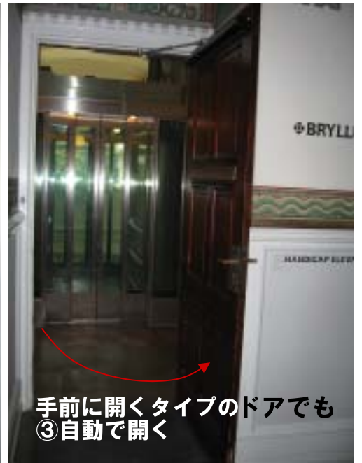
手前に開くタイプのドアでも ③自動で開く

コペンハーゲン市庁舎は中央駅のすぐ近くにあり、20世紀初頭に建てられました。建物自体もイタリアのルネッサンス様式を取り入れた建物で歴史を感じます。歴史があるだけに簡単に建て直したりできない市庁舎は利用者のことを考えた工夫をしています。現状を保ちながらのユニバーサルデザインは私たちの地域にも大変参考になります。