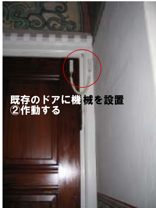
既存のドアに機械を設置 ②作動する