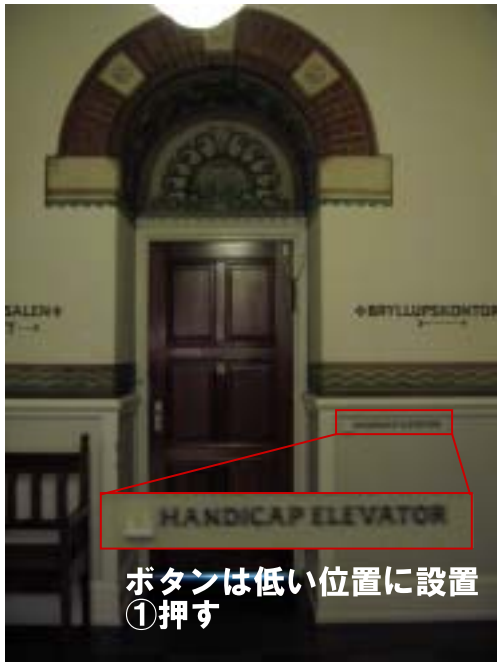
ボタンは低い位置に設置 ①押す