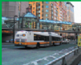
2. ADA法の国内インストラクターの中心的役割