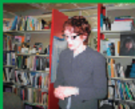
6. 視力・聴覚・触覚・嗅覚・味覚