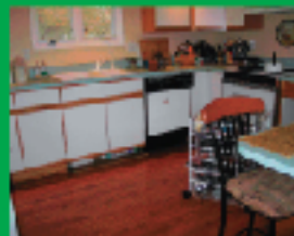
7. アイディア・キックオフ