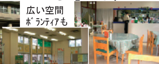
NPOレストラン UDファッションショップなども