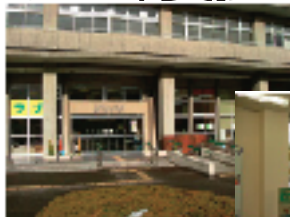
広い空間 ボランティアも

施設はハード的に充実した機能で昨年からは指定管理者がNPOになって、システムのにも展開に期待!