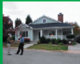
3. 低所得者用のUD住宅設計開発者の取組み