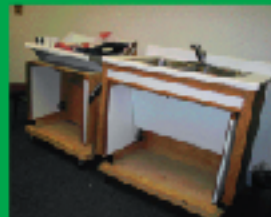
4. ADA法を上回るUD規格が出来よう促進