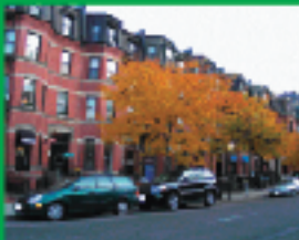
1. 西レンガの基調作風(1・2・3・4階)