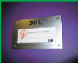
5. 数字文字・サインプレート