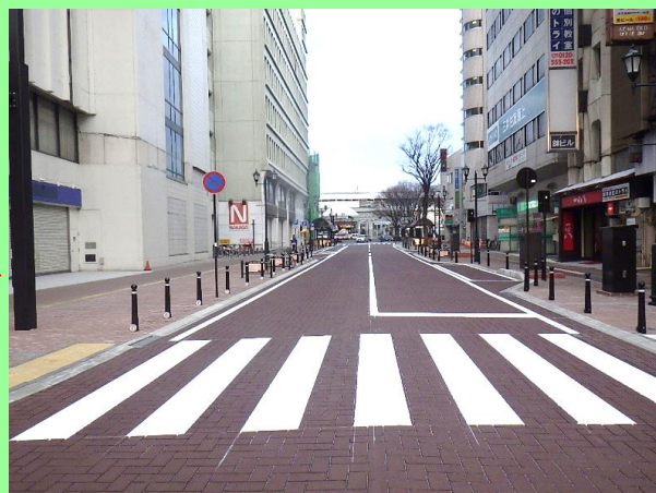
セブンイレブン交差点から福島駅方面を望む