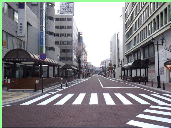
福島駅前から国道13号方面を望む