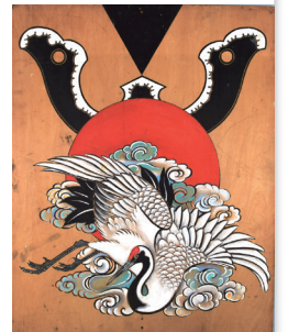
上棟式の矢羽根 (岩浅松石筆)

会津には曲屋の民家や職人巻物、火難除けの呪物など特有の文化があります。屋根葺き職人や越後大工などの出稼ぎによる交流も盛んで、鍛冶屋による道具作りの技術も繁栄しました。職人の道具や儀礼などから会津の建築文化をまるごと紹介します。