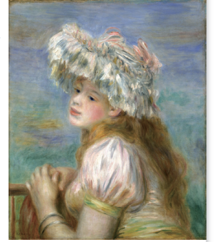
ルノワール「レースの帽子の少女」1891年 ポーラ美術館蔵

量・質ともに充実した西洋絵画のコレクションを誇る箱根のポーラ美術館。ルノワール、モネ、ピカソら巨匠の名品72点をお楽しみください。