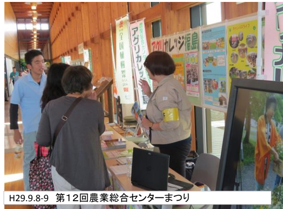
H29.9.8-9 第12回農業総合センターまつり