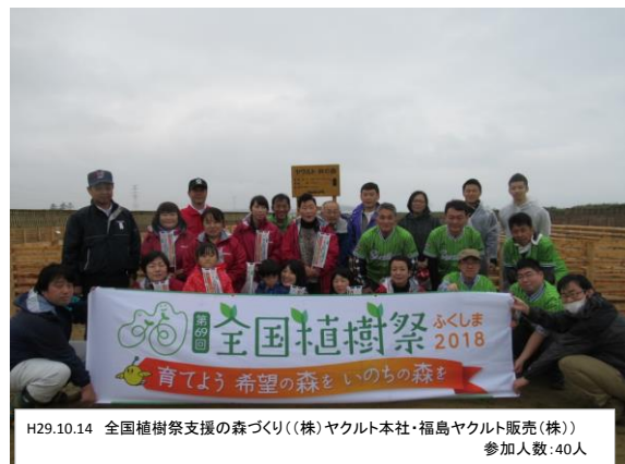
H29.10.14 全国植樹祭支援の森づくり(株)ヤクルト本社・福島ヤクルト販売(株) 参加人数:40人