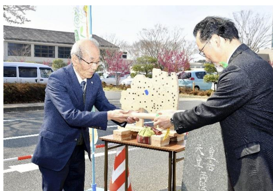
(花と緑いっぱいのふるさとづくりプロジェクト)