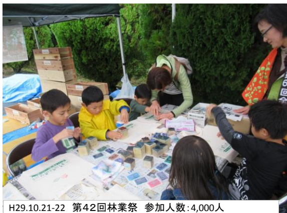
H29.10.21-22 第42回林業祭 参加人数:4,000人