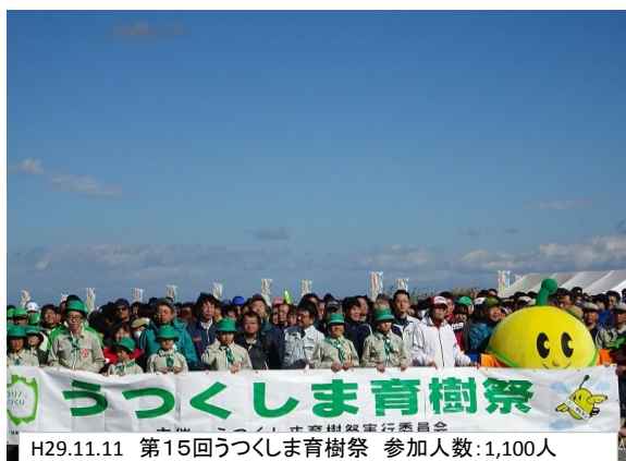
H29.11.11 第15回うつくしま育樹祭 参加人数:1,100人