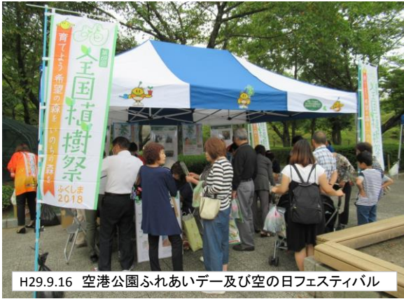
H29.9.16 空港公園ふれあいデー及び空の日フェスティバル