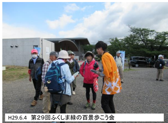
H29.6.4 第29回ふくしま緑の百景歩こう会