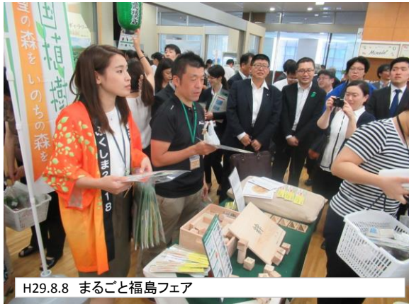
H29.8.8 まるごと福島フェア