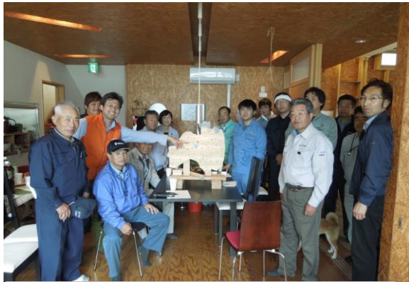
H29.6.3 福島県素材生産協同組合第2回植樹祭 参加人数:40人