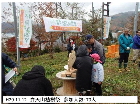
H29.11.12 弁天山植樹祭 参加人数:70人