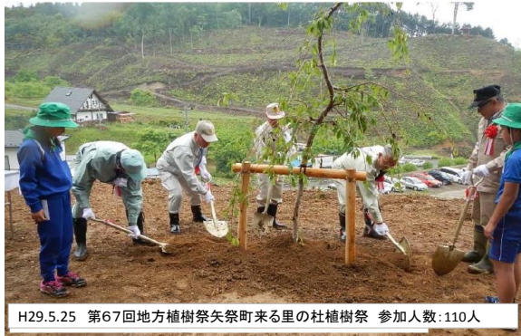
H29.5.25 第67回地方植樹祭矢祭町来る里の杜植樹祭 参加人数:110人