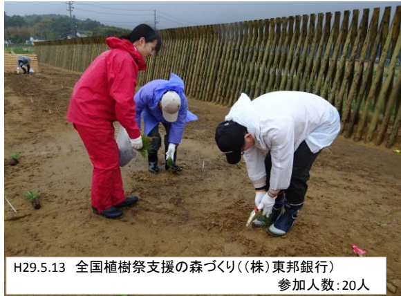
H29.5.13 全国植樹祭支援の森づくり((株)東邦銀行) 参加人数:20人