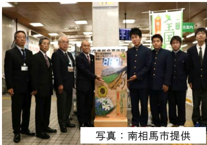
南相馬市作製のカウントダウンボード

福島駅、郡山駅 新白河駅、会津若松駅 いわき駅、会津田島駅 フォレストパークあだたら （サテライト会場） 南相馬市役所 （南相馬市が別途作製）