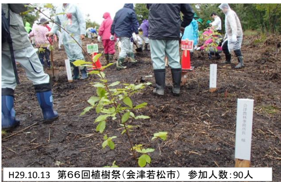
H29.10.13 第66回植樹祭(会津若松市) 参加人数:90人