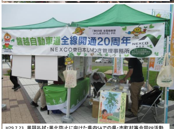
H29.7.23 風評払拭・風化防止に向けた県内SAでの県・市町村等合同PR活動