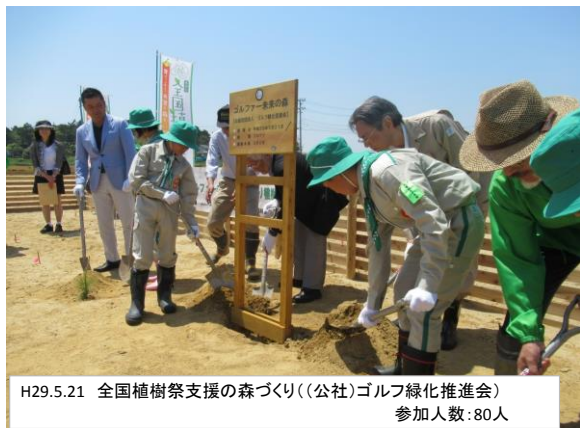
H29.5.21 全国植樹祭支援の森づくり((公社)ゴルフ緑化推進会) 参加人数:80人