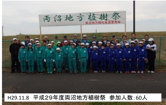
H29.11.8 平成29年度両沼地方植樹祭 参加人数:60人