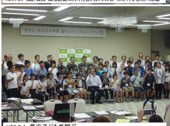
H29.8.4 県庁子ども参観デー