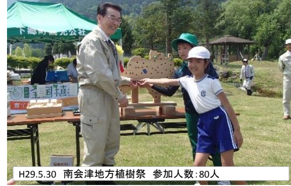
H29.5.30 南会津地方植樹祭 参加人数:80人