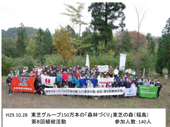
H29.10.28 東芝グループ150万本の「森林づくり」東芝の森(福島) 第8回植樹活動 参加人数:140人