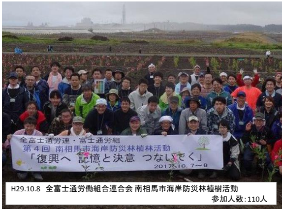
H29.10.8 全富士通労働組合連合会 南相馬市海岸防災林植樹活動 参加人数:110人