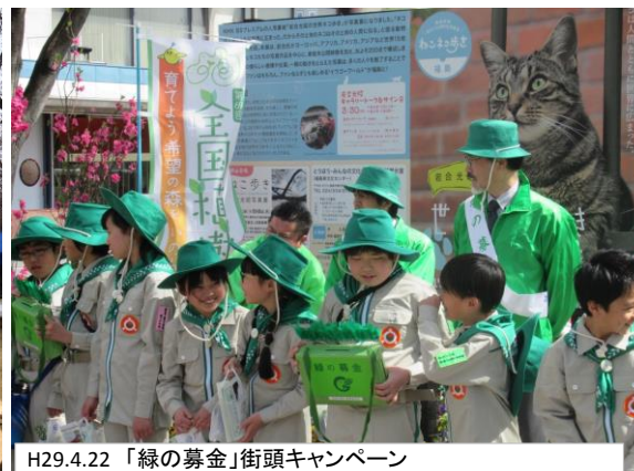
H29.4.22 「緑の募金」街頭キャンペーン