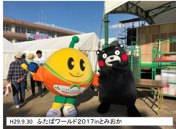
H29.9.30 ふたばワールド2017inとみおか