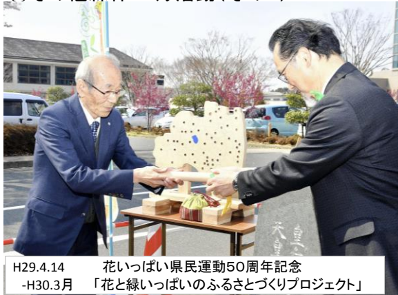
H29.4.14 花いっぱい県民運動50周年記念 -H30.3月 「花と緑いっぱいのふるさとづくりプロジェクト」