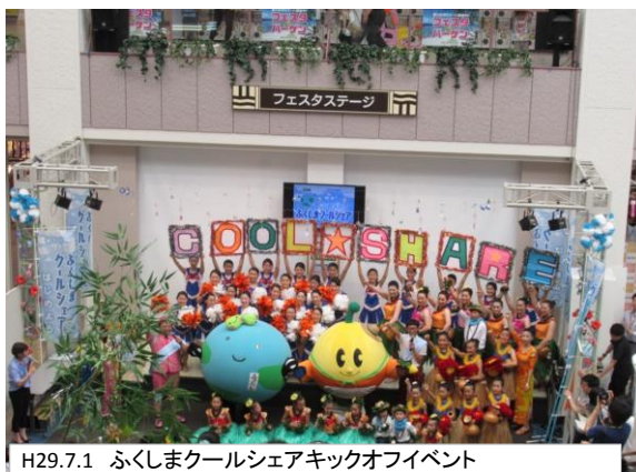
H29.7.1 ふくしまクールシェアキックオフイベント