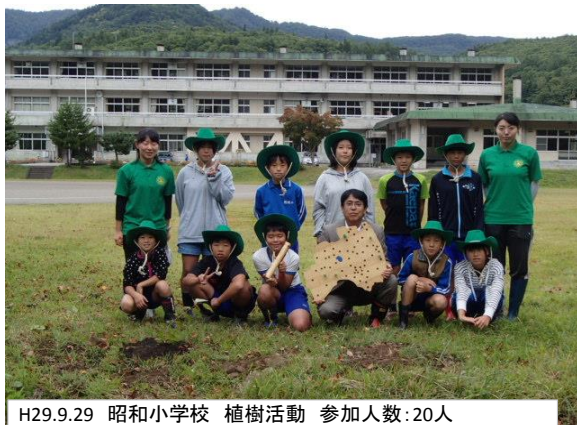
H29.9.29 昭和小学校 植樹活動 参加人数:20人