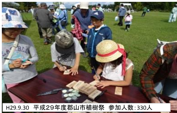
H29.9.30 平成29年度郡山市植樹祭 参加人数:330人