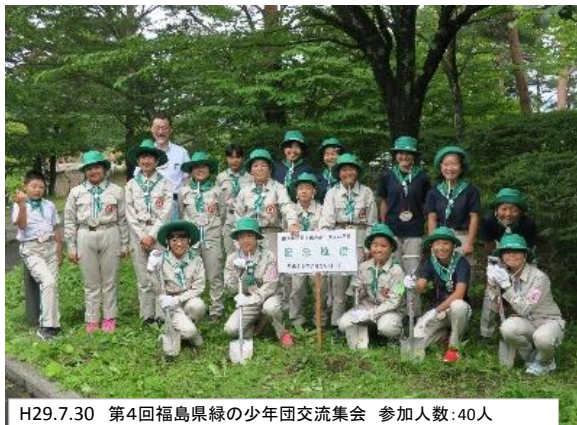
H29.7.30 第4回福島県緑の少年団交流集会 参加人数:40人