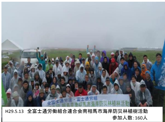
H29.5.13 全富士通労働組合連合会南相馬市海岸防災林植樹活動 参加人数:160人