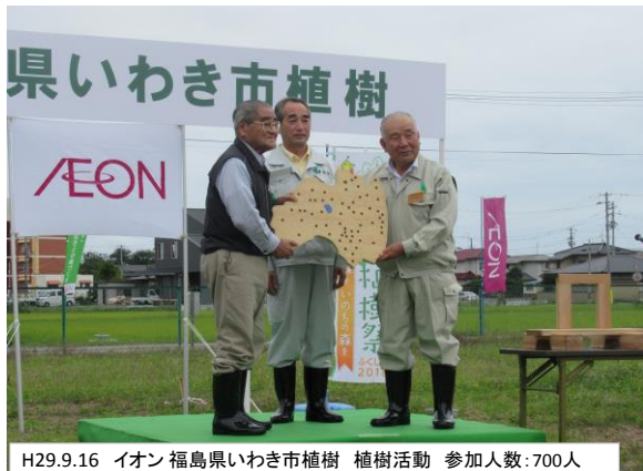
H29.9.16 イオン福島県いわき市植樹 植樹活動 参加人数:700人