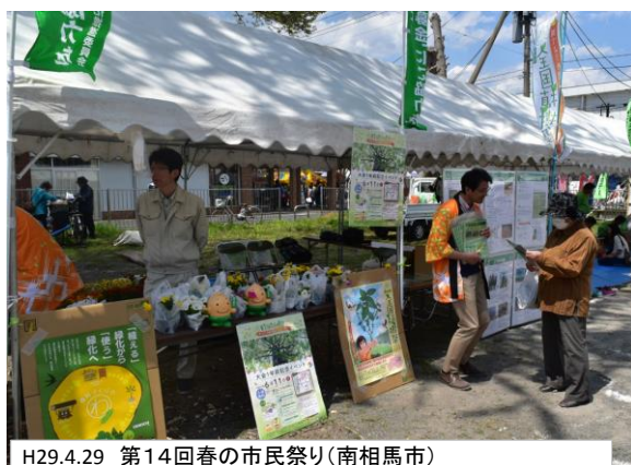
H29.4.29 第14回春の市民祭り(南相馬市)