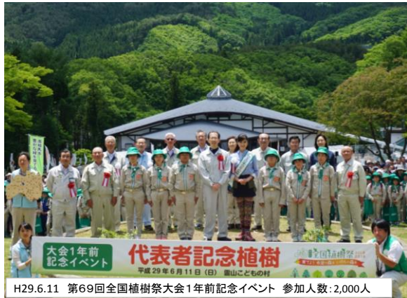
H29.6.11 第69回全国植樹祭大会1年前記念イベント 参加人数:2,000人