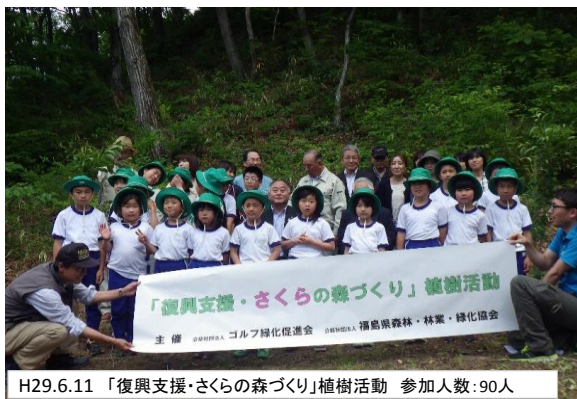
H29.6.11 「復興支援・さくらの森づくり」植樹活動 参加人数:90人