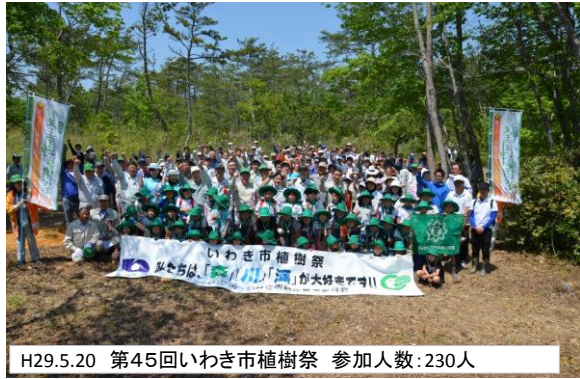
H29.5.20 第45回いわき市植樹祭 参加人数:230人