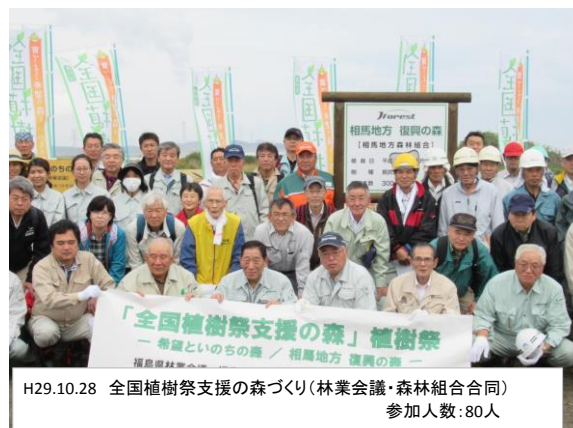
H29.10.28 全国植樹祭支援の森づくり(林業会議・森林組合合同) 参加人数:80人