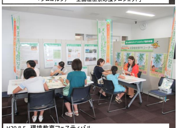
H29.8.5 環境教育フェスティバル