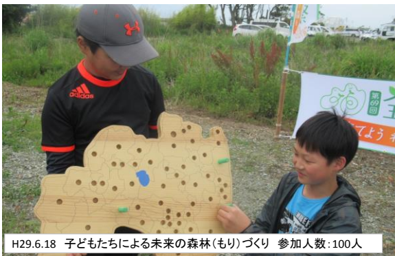
H29.6.18 子どもたちによる未来の森林(もり)づくり 参加人数:100人