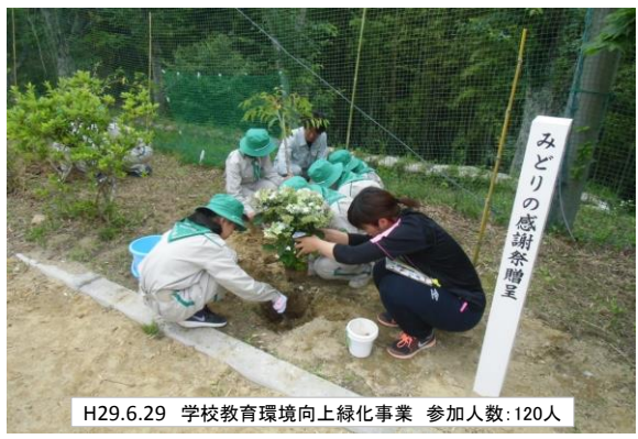
H29.6.29 学校教育環境向上緑化事業 参加人数:120人