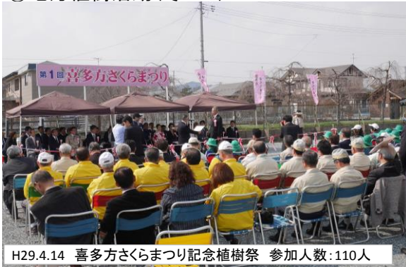
H29.4.14 喜多方さくらまつり記念植樹祭 参加人数:110人