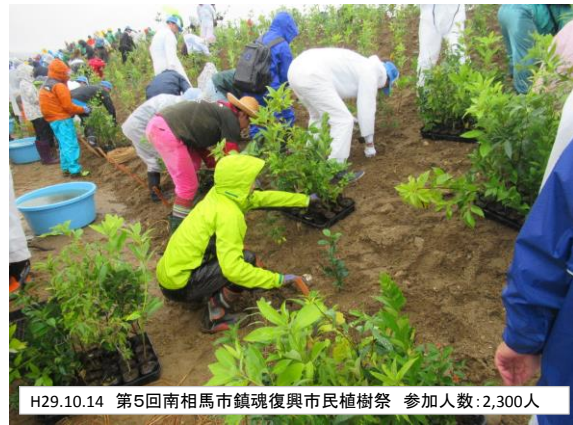
H29.10.14 第5回南相馬市鎮魂復興市民植樹祭 参加人数:2,300人