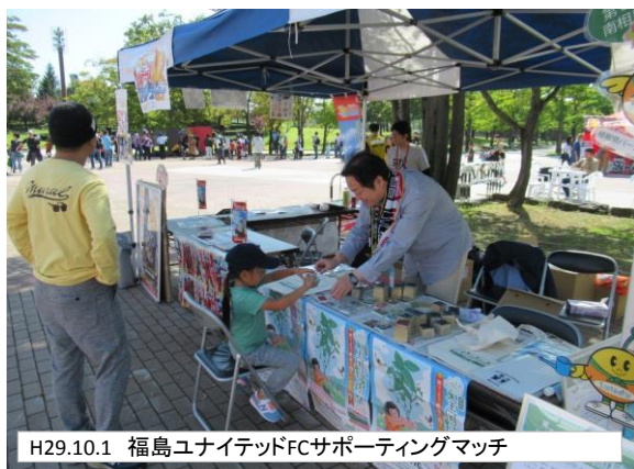
H29.10.1 福島ユナイテッドFCサポーターティングマッチ