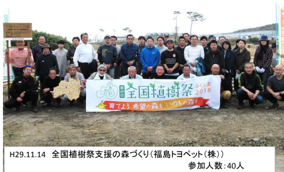
H29.11.14 全国植樹祭支援の森づくり(福島トヨペット(株)) 参加人数:40人