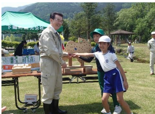
(南会津地方植樹祭)