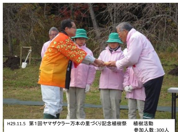
H29.11.5 第1回ヤマザクラ一万本の里づくり記念植樹祭 植樹活動 参加人数:300人