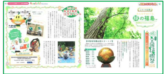
『元気ッズ！ふくしま』2017年7月号

②『元気ッズ！ふくしま』【2017年7月号】 【2017年9月号】【2017年12月号】