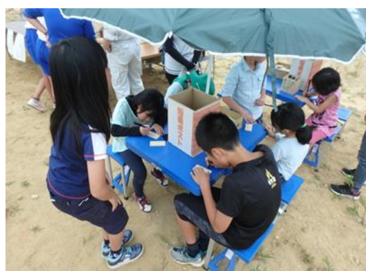
(木製短冊に森林(もり)づくりへの想いを記入)