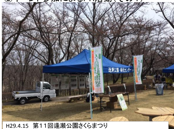
H29.4.15 第11回逢瀬公園さくらまつり