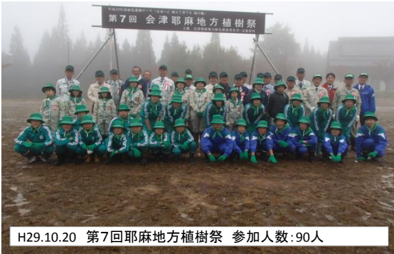
H29.10.20 第7回会津耶麻地方植樹祭 参加人数:90人