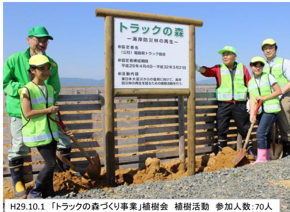
H29.10.1 「トラックの森づくり事業」植樹会 植樹活動 参加人数:70人