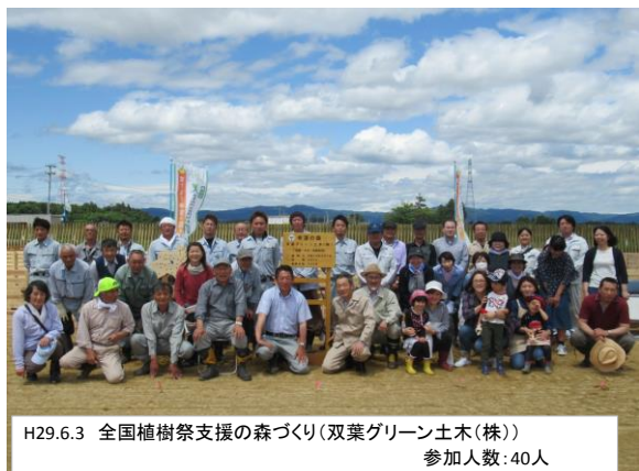
H29.6.3 全国植樹祭支援の森づくり(双葉グリーン土木(株)) 参加人数:40人