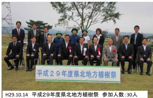
H29.10.14 平成29年度県北地方植樹祭 参加人数:30人