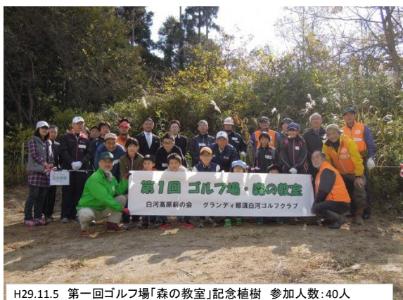
H29.11.5 第一回ゴルフ場「森の教室」記念植樹 参加人数:40人