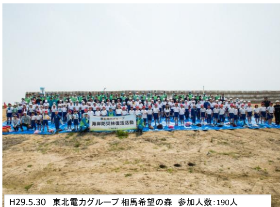
H29.5.30 東北電力グループ 相馬希望の森 参加人数:190人