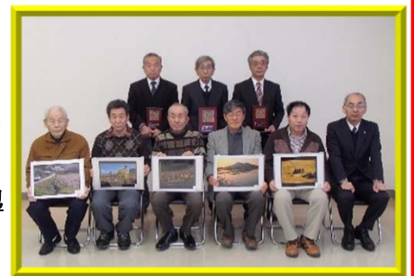
↑ 優良活動表彰の受賞された組織代表の皆さん(後列)と写真コンテストの受賞者の皆さん(前列)

特別賞＝浜尾地区資源保全隊(須賀川市)、板仲みんなの里山保全会(石川町) 板橋環境保全会(白河市)、湯川村農地保全協議会(湯川村)