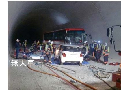
消防訓練実施状況