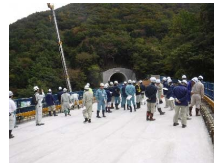
現場研修会の状況