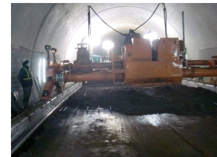
コンクリート舗装施工状況